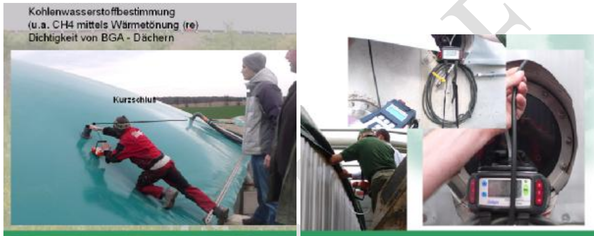
Bild 3 und 4. Die Prüfgasentnahme ist gemäß linkem Bild gesichert aus der Abluftöffnung zu entnehmen. Im linken Bild wird jedoch das Stützluftpolster nicht komplett quer durchströmt. Im rechten Bild sind sog. Personenschutzmeßgeräte zur Messung verwendet worden, die vor einer gefährlichen explosionsfähigen Atmosphäre (geA) warnen und nicht Konzentrationen im ppm – Bereich (wie im linken Bild) messen können.