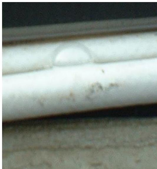
Bild 7. Diese Meßmethode (Nachweis mit schaubildendem Mittel) weist zwar eine Undichtigkeit nach, gibt jedoch keinen Hinweis auf Gasqualität noch Gasquantität

Dichtheitsprüfungen z.B. gem. DVGW G 469 A4: Sichtverfahren mit Betriebsdruck und schaubildendem Mittel