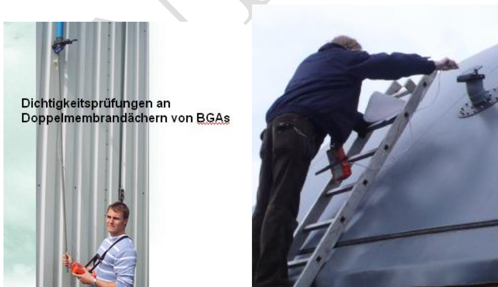
Bild 5 und 6. Die Prüfgasentnahme erfolgt korrekt aus der Abluftöffnung

Bild 3 und 4. Die Prüfgasentnahme ist gemäß linkem Bild gesichert aus der Abluftöffnung zu entnehmen. Im linken Bild wird jedoch das Stützluftpolster nicht komplett quer durchströmt. Im rechten Bild sind sog. Personenschutzmeßgeräte zur Messung verwendet worden, die vor einer gefährlichen explosionsfähigen Atmosphäre (geA) warnen und nicht Konzentrationen im ppm – Bereich (wie im linken Bild) messen können.